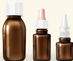
líquido en frascos, goteros o vaporizadores