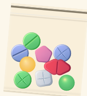
pastillas de colores